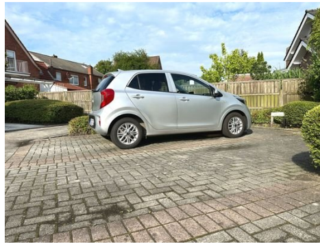
2 PKW Stellplätze