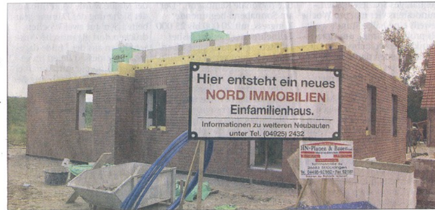
In der Robert Bunsen Straße entsteht dieses Einfamilienhaus.