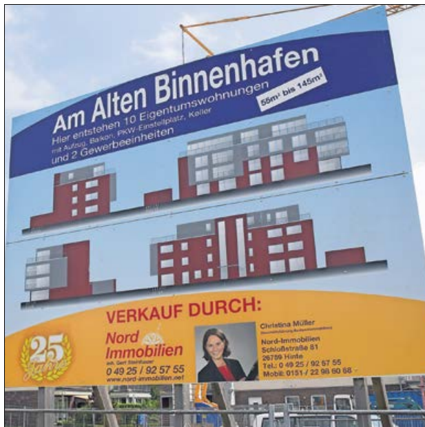
Am Alten Binnenhafen, genauer in der Hermann-Neemann-Straße 3, entsteht dieser Neubau mit Wohn- und Geschäftsflächen.

Die Wohnungen werden qualitativ sehr hochwertig ausgestattet und sind über einen Fahrstuhl erreichbar. Al-