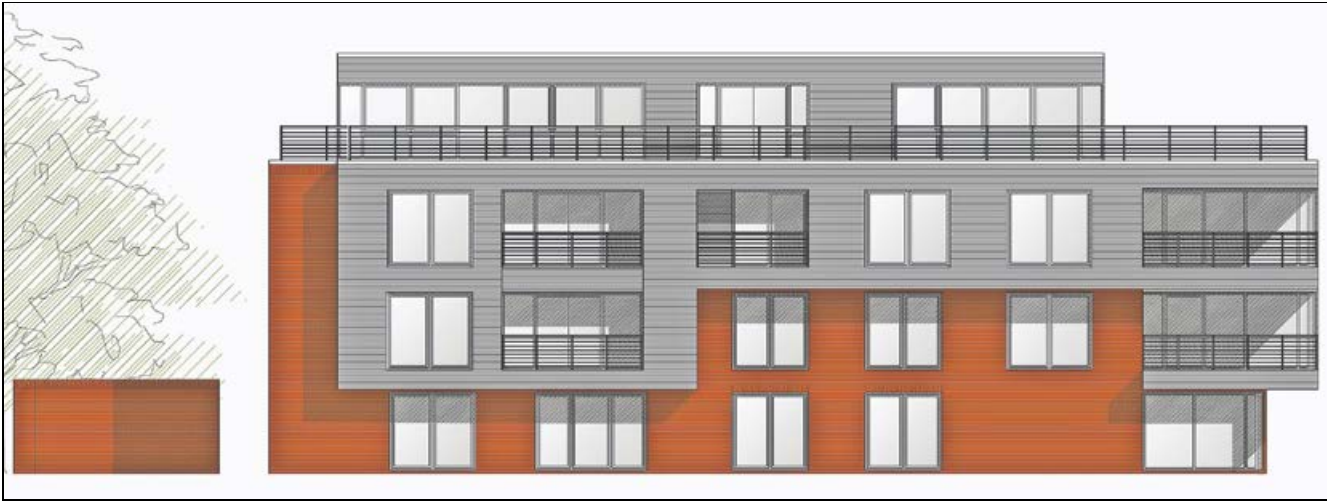
So soll das neue Objekt nach dem derzeitigen Entwurf aussehen. Hier die Ansicht von Westen aus.